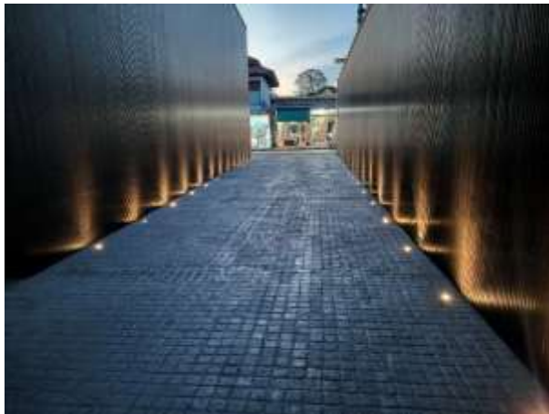
รูปที่ 3 ไฟส่องสว่างทางเดินภายในโครงการ