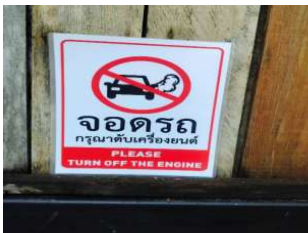
รูปที่ 5 ป้ายดับเครื่องยนต์ภายในโครงการ