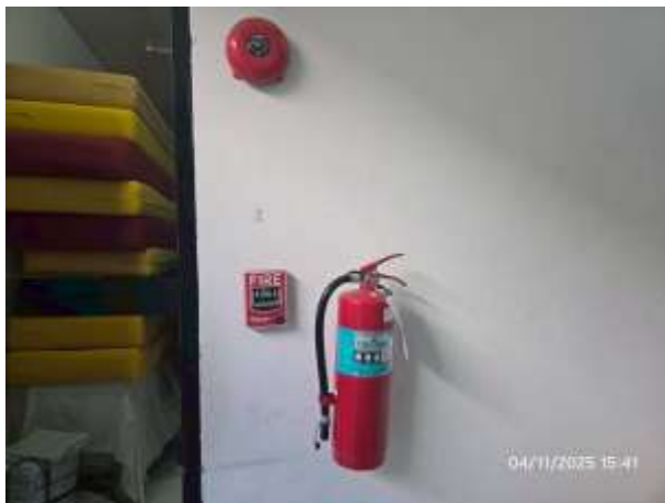
รูปที่ 19 ถังดับเพลิงพร้อมป้ายแนะนำวิธีใช้อุปกรณ์