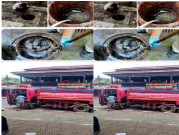
รูปที่ 33 รถเข้าสูบสิ่งปฏิกูล