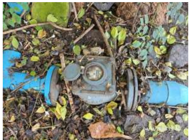
รูปที่ 10 มิเตอร์น้ำเสียภายในโครงการ