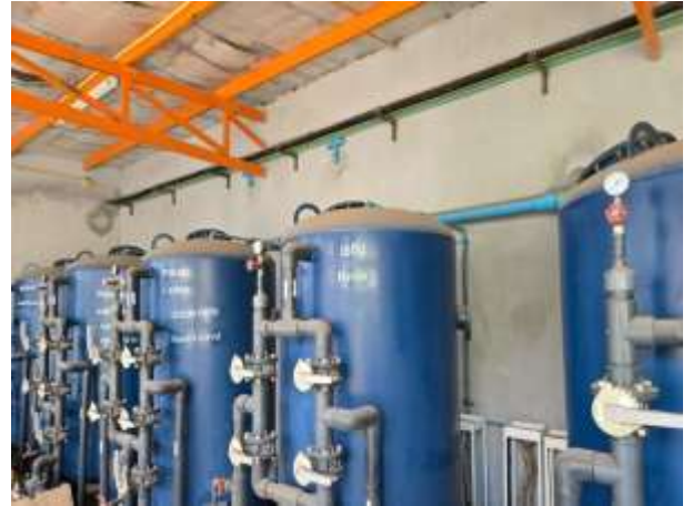
รูปที่ 8 ระบบปรับปรุงคุณภาพน้ำภายในโครงการ