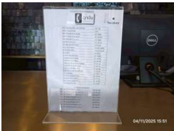
รูปที่ 21 เบอร์โทรศัพท์แจ้งเหตุฉุกเฉิน