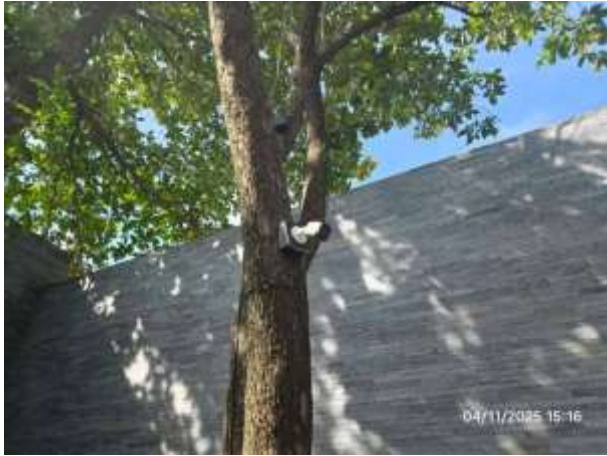
รูปที่ 31 ระบบ CCTV ภายในโครงการ