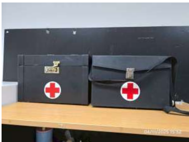
รูปที่ 41 อุปกรณ์ปฐมพยาบาลเบื้องต้น