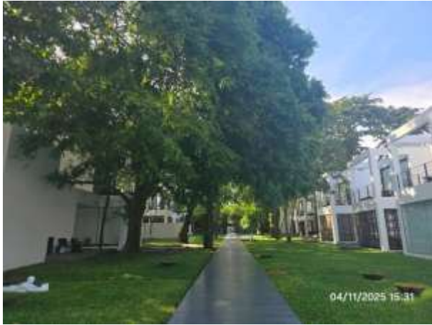
รูปที่ 1 พื้นที่สีเขียวภายในโครงการ