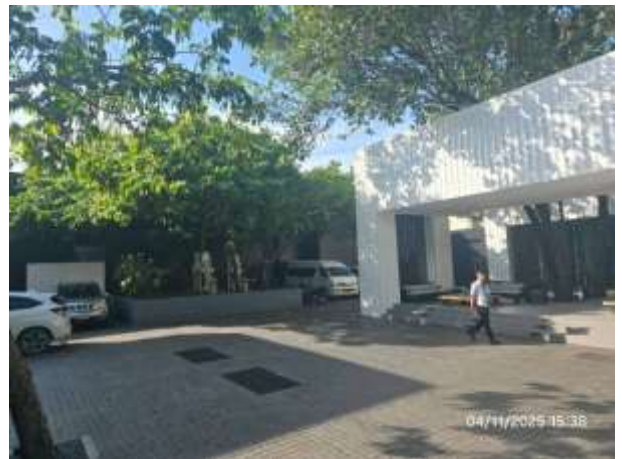
รูปที่ 20 จุดรวมพลภายในโครงการ