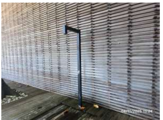
รูปที่ 24 จุดชำระล้างตัวก่อนลงสระว่ายน้ำ