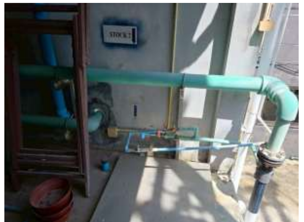
รูปที่ 36 ทางค์สำรองน้ำใช้ในโครงการ