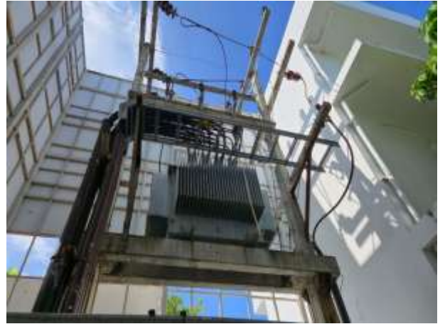
รูปที่ 32 หม้อแปลงไฟฟ้าภายในโครงการ