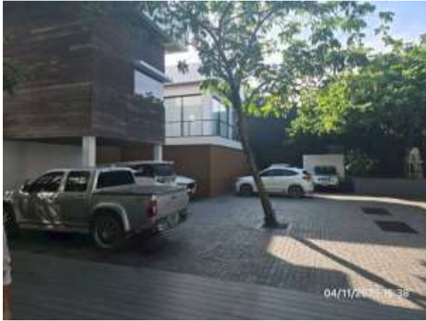
รูปที่ 7 ลานจอดรถภายในโครงการ