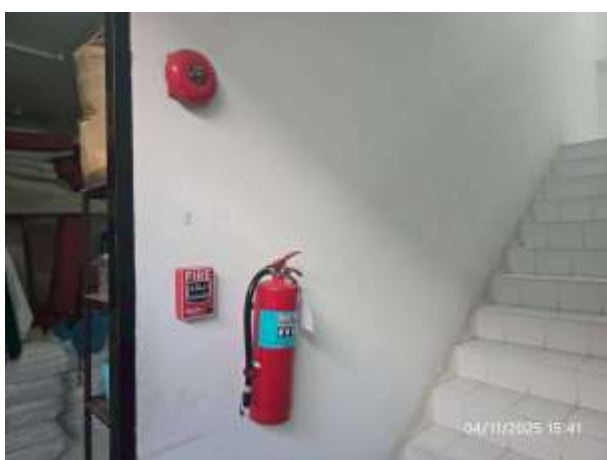
รูปที่ 17 อุปกรณ์ส่งสัญญาณเกิดเหตุเพลิงไหม้ภายในโครงการ