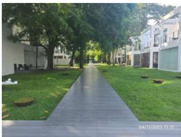
รูปที่ 29 สถาปัตยกรรมภายในโครงการส่วนเดิม