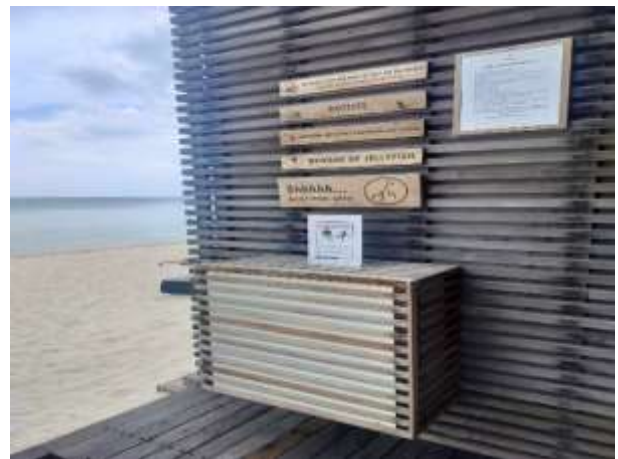
รูปที่ 26 กฎการใช้สระว่ายน้ำและข้อควรระวังลงเล่นน้ำหน้าหาด