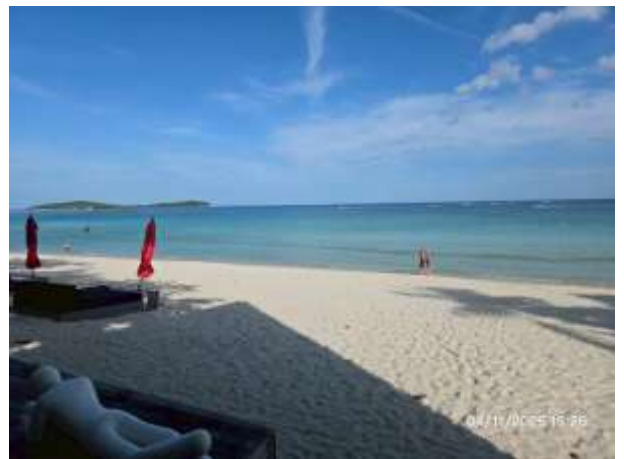
รูปที่ 38 ชายหาดหน้าโครงการ