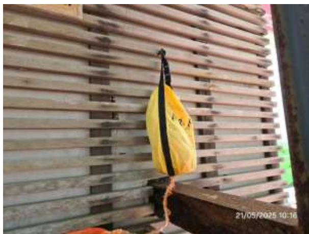
รูปที่ 27 เชือกช่วยชีวิต