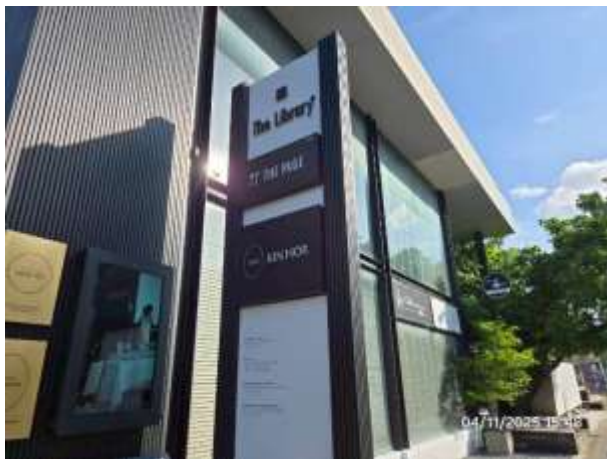
รูปที่ 39 ป้ายโครงการ