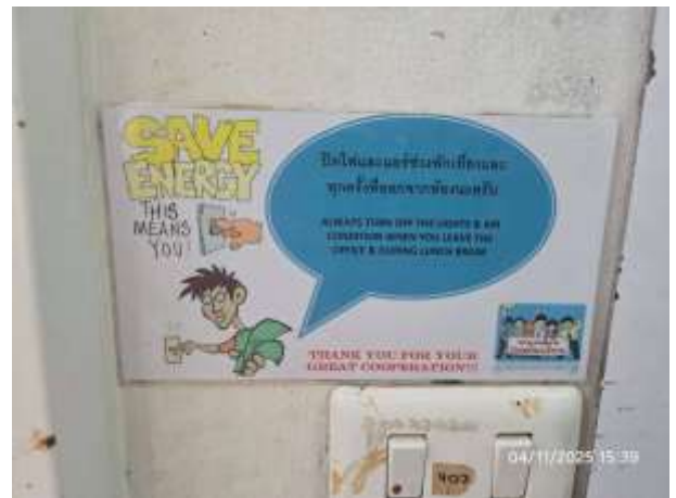
รูปที่ 14 ป้ายรณรงค์ประหยัดไฟภายในโครงการ