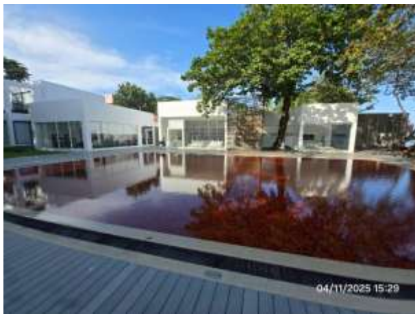
รูปที่ 25 สระว่ายน้ำส่วนกลาง