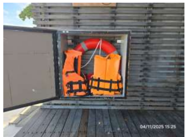
รูปที่ 28 เสื้อชูชีพและห่วงยางช่วยชีวิต