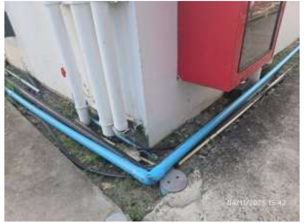
รูปที่ 34 ระบบเส้นท่อประปาภายในโครงการ