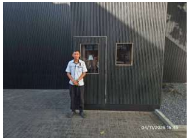
รูปที่ 4 เจ้าหน้าที่รักษาความปลอดภัยภายในโครงการ