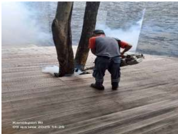
รูปที่ 35 บริษัทเข้ากำจัดฉีดพ่นแมลง