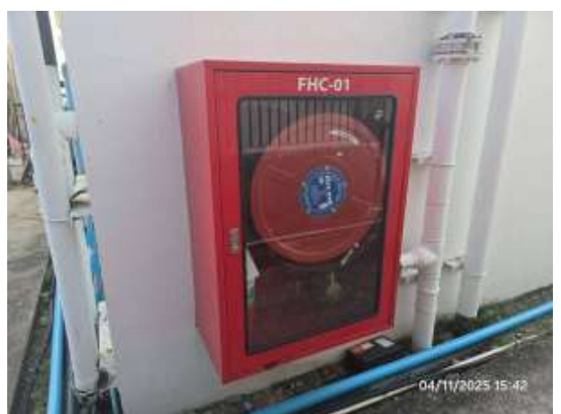
รูปที่ 18 ตู้เก็บอุปกรณ์ดับเพลิง