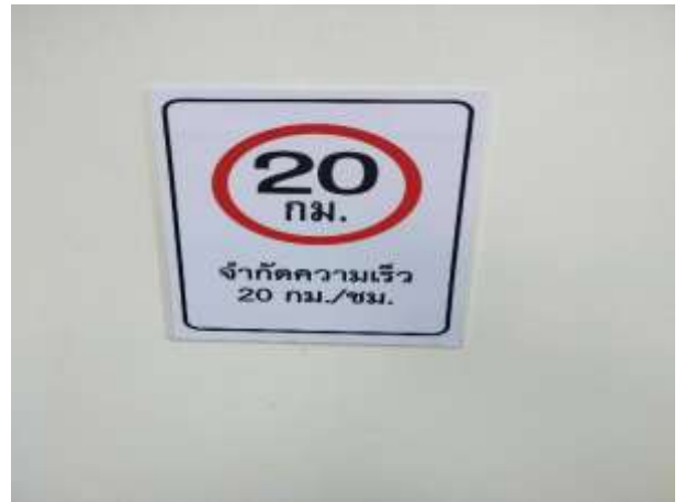
รูปที่ 2 ป้ายจำกัดความเร็วภายในโครงการ