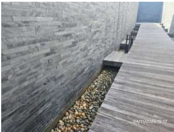
รูปที่ 9 รางระบายน้ำฝนภายในโครงการ