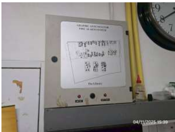
รูปที่ 15 ระบบแจ้งเตือนเหตุเพลิงไหม้แบบกราฟิกภายในโครงการ