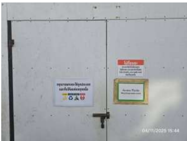
รูปที่ 11 ห้องพักขยะแห้งภายในโครงการ