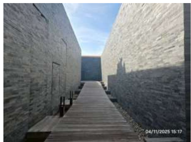
รูปที่ 30 สถาปัตยกรรมภายในโครงการส่วนขยาย