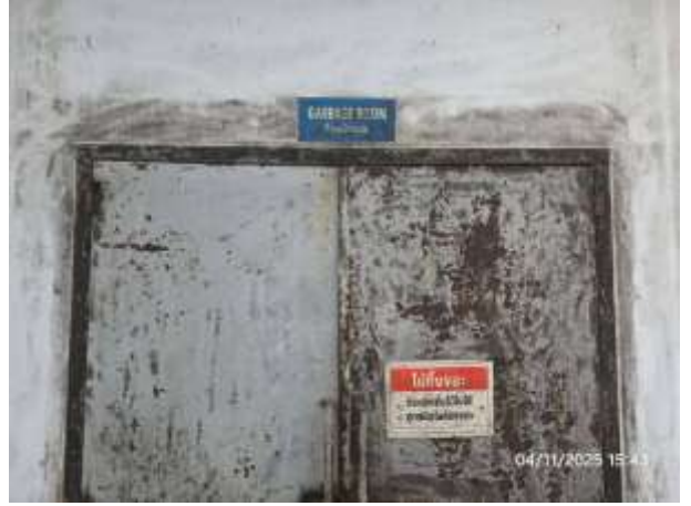
รูปที่ 12 ห้องพักขยะเปียกภายในโครงการ