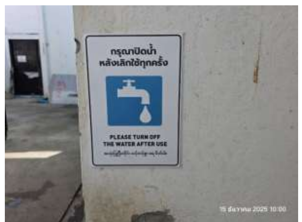
รูปที่ 6 ป้ายรณรงค์ประหยัดน้ำภายในโครงการ