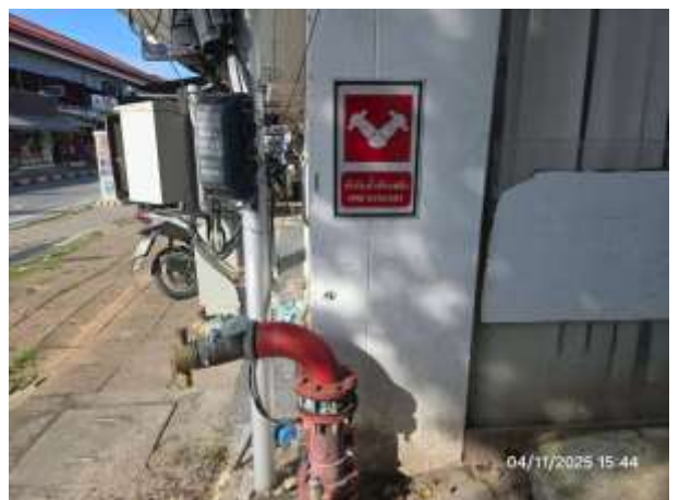
รูปที่ 16 หัวรับน้ำดับเพลิงภายนอกโครงการ