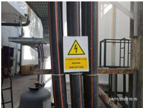
รูปที่ 13 ป้ายเตือนอันตรายไฟฟ้าแรงสูงภายในโครงการ