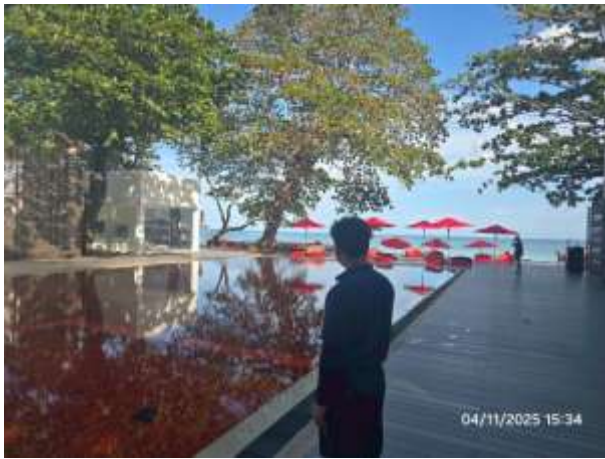
รูปที่ 37 เจ้าหน้าที่ดูแลช่วยเหลือประจำสระว่ายน้ำ