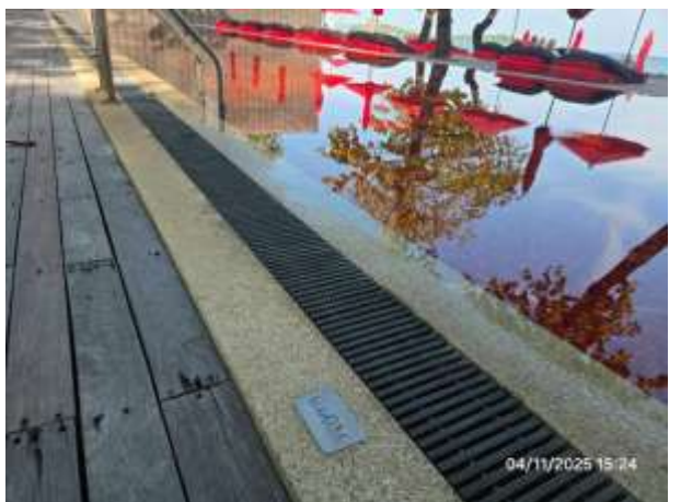
รูปที่ 22 รางระบายน้ำล้นรอบสระว่ายน้ำ