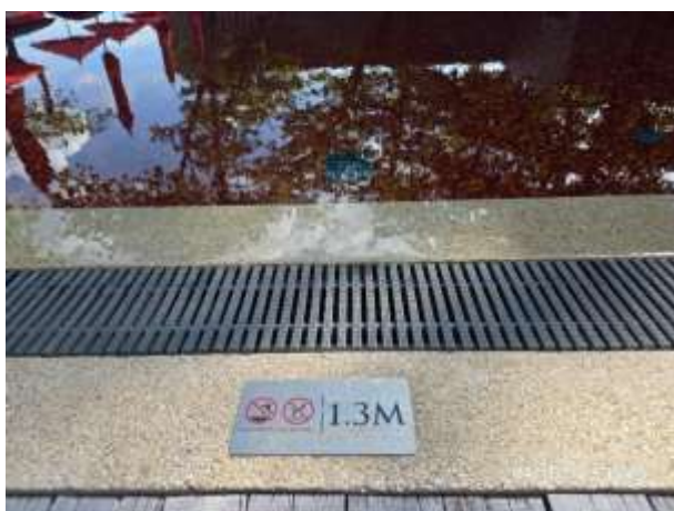
รูปที่ 23 ตัวเลขบอกระดับความลึกของสระว่ายน้ำ