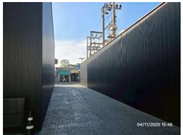
รูปที่ 40 ทางเข้าออกโครงการ